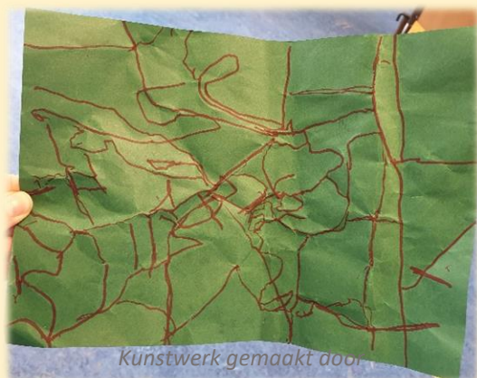
Kunstwerk gemaakt door

Zo kwam de leerling zelf op het idee om de tekening te ontvouwen en de kreukels te arceren en creëerde zo iets nieuws.