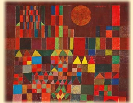
'Kasteel en zon' (1928) - Paul Klee

Naar aanleiding van het schilderij Kasteel en zon (1928) van Paul Klee (1897-1940) besprak de klas niet alleen uit welke geometrische vormen een gebouw bestaat, maar ook wat voor gebouwen er allemaal te zien zijn in een stad. In tweetallen deelden de leerlingen hun ideeën over wat ze belangrijke gebouwen vonden in de stad. Een groepje schilderde uiteindelijk een Metropool (deze titel hadden ze zelf bedacht). Tijdens hun samenwerking kwamen ze op het idee om al hun gebouwen te verbinden met glijbanen, zodat de stad meer een geheel werd.