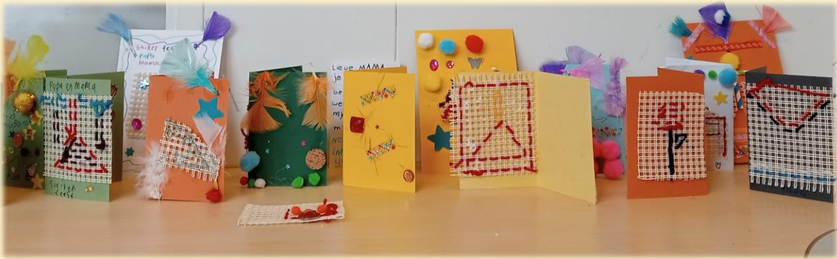
Geborduurde kaarten die de leerlingen maakten voor Moederdag

omdat ze altijd voor je zorgen. Een andere leerling gaf als tegenargument dat kinderen die geadopteerd zijn, of van wie de ouders overleden zijn, geen moeders hebben die voor ze zorgen. Deze opmerking zorgde voor enige opheffing, omdat de meeste er geen voorstelling bij hadden. Maar doordat deze leerling zijn opvatting tijdens het presenteren met de klas te durfden te delen, belichtte dit voor iedereen een nieuw perspectief.