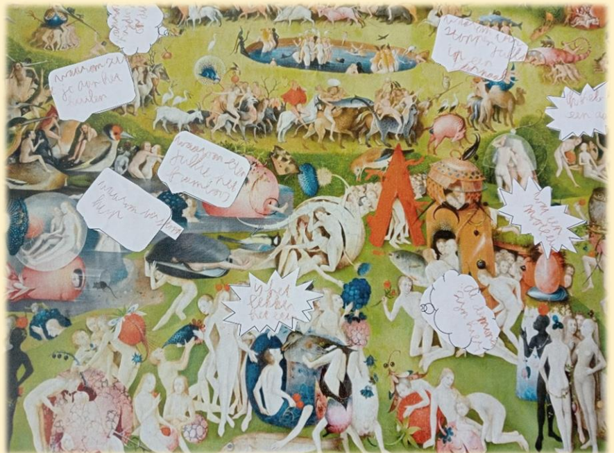
De tuin der Lusten met toegevoegde tekst van leerlingen