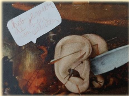
Toegevoegde tekst: 'Heb je weer de oven aan laten staan?'

Dit gesprek eindigde niet met een eenduidig antwoord, maar iedereen was tijdens de bespreking betrokken en deelden zijn/haar mening. Hierbij werd er met respect, interesse en vooral veel plezier naar elkaar geluisterd.