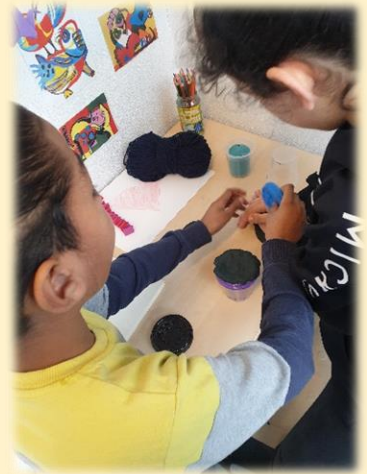
Leerlingen die in het terug trek hoekje aan het kleien zijn

Dit bleek uit hoe de leerlingen zelfstandig met materialen aan de slag gingen in het hoekje op de gang. Vaak kleiden ze of vonden ze het fijn om met wollen draadjes te spelen. Ook werden er tekeningen gemaakt of kleine stukjes tekst geschreven.