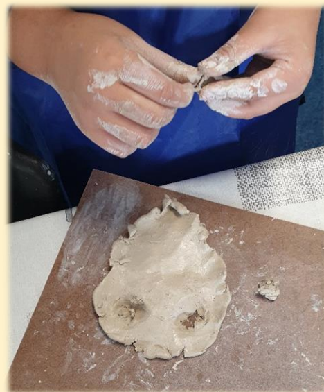
Leerling die tijdens de les experimenteert met klei

Deze werkwijze motiveerde leerlingen om beelden te laten ontstaan zonder oordeel en zo op speelse wijze buiten hun eigen comfort zone te treden. Andere raakten zo geïntrigeerd door de handeling van het boetseren zelf en gebruikten het met name als emotionele uitlaatklep.