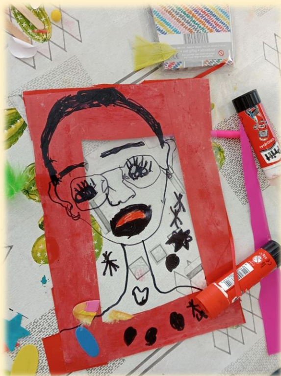
Portret gemaakt door leerling

Aan het einde van de les concludeerde een leerling over het portret van een; ‘Ik vind het mooi, omdat jij het gemaakt hebt’.