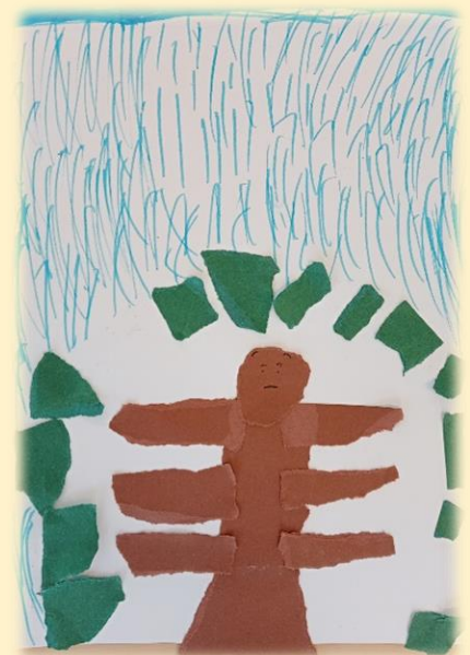
Kunstwerk van een tor in de regen

Een leerling maakte een torretje, en gaf vroegtijdig aan dat zijn werk af was. Het torretje stond in het midden van het witte papier met wijd gespreide pootjes en een beteuterd gezichtje. De leerling vertelde dat de tor niet blij was, omdat hij niet tevreden was met de cijfers op zijn rapport. Ook gaf de leerling aan veel over de natuur te weten. Zo wist hij dat insecten 'tussen de blaadjes' leven. Samen waren we het er daarom unaniem over eens dat hij dit nog kon toegevoegd aan de mozaïek. Tot slot bedacht de leerling dat regen het beste paste bij het humeur van de tor. De blaadjes plakte hij in een koepel vorm om de tor