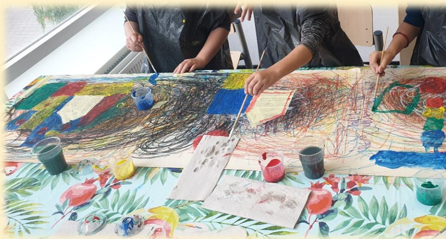
Leerlingen die tijdens de les samen aan hun stadsschildering werken