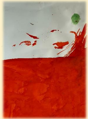
Portret van een gesluierde vrouw, dat per toeval gemaakt werd

Dit schilderij hangt aan de muur in het klaslokaal, om te illustreren hoe uit toeval mooie dingen kunnen ontstaan. De leerlingen die hier aan hebben gewerkt, waren begonnen met het rood kleuren van de achtergrond, maar hadden halsoverkop hun ongewassen kwasten op het papier laten liggen, waardoor de afdruk van hun penselen leek op een gezicht van een vrouw verscholen achter een rode sluier.