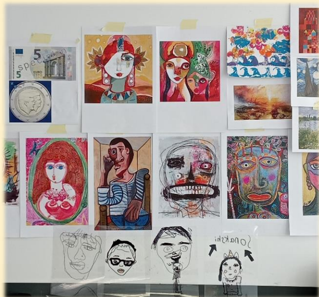
Voorbeelden van portretten die ik gebruikte tijdens de les