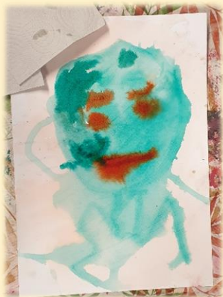
Figuurstuk ontstaan door het experimenteren met ecoline en water